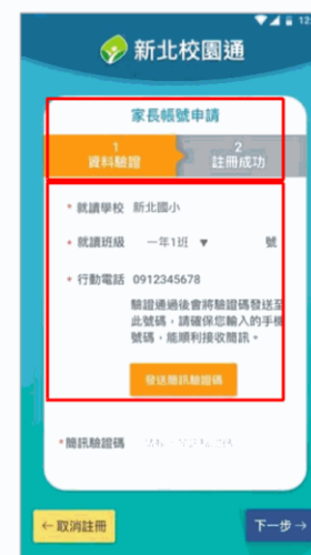
3. 雙重資料驗證 (子女資料比對、手機號碼簡訊驗證)