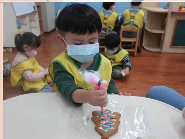
體驗薑餅DIY，到各個處室報佳音