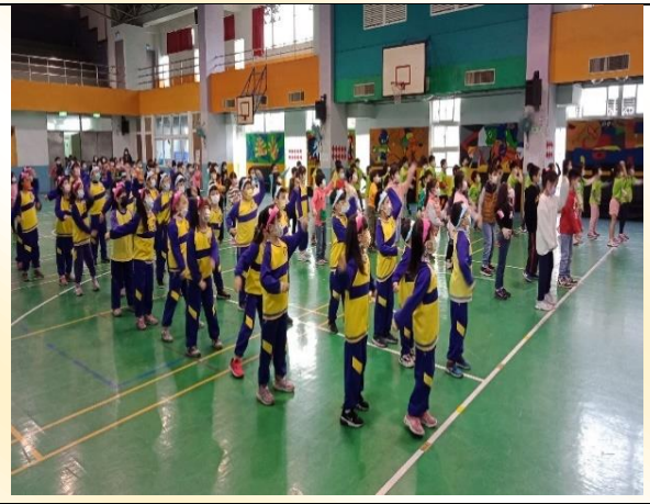
二年級健身操比賽：健康身體好