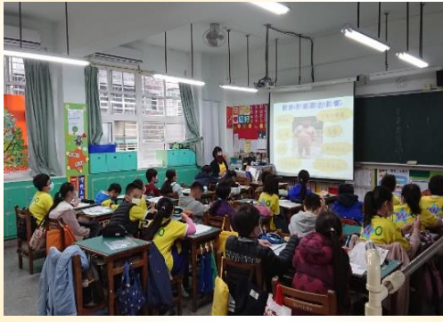
高年級線上營養宣導