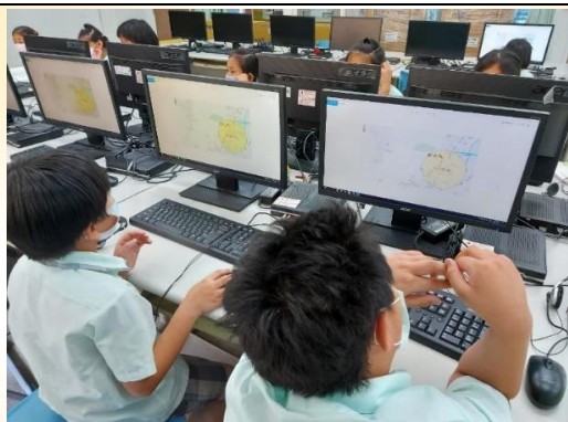
資訊融入交通安全宣導