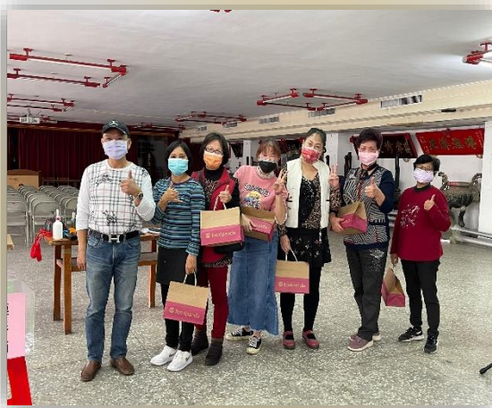
志工歲末感恩餐會