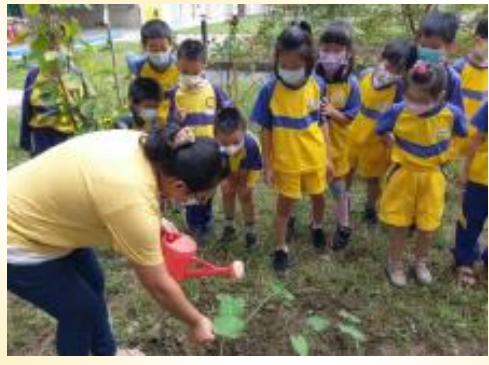
二年級食農課程： 認識植物、果皮廚餘再利用