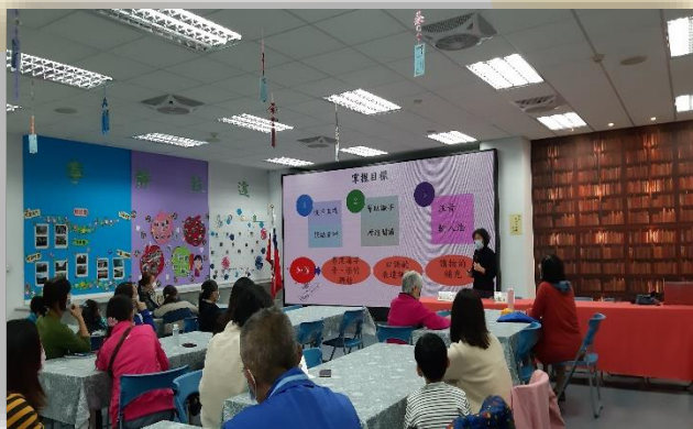
志工特殊訓-注音符號增能活動