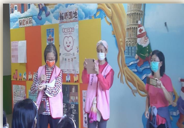
英文補救志工辦理萬聖節活動