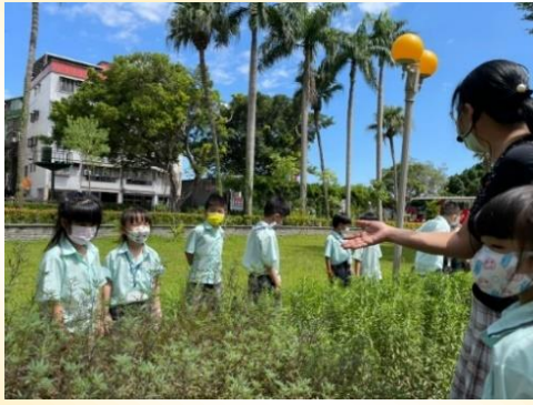
一年級食農課程：認識香草