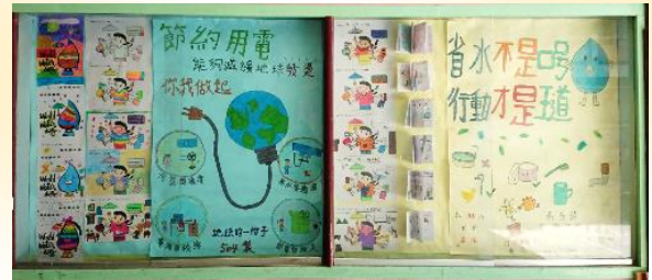
環保小局長藝文活動：著色畫、小書、海報