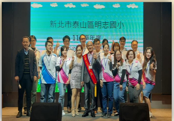
家長委員參與萬聖節活動協助