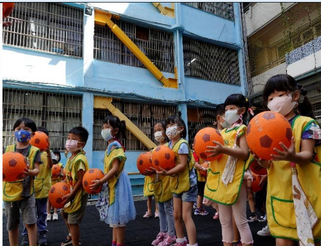
中庭的黑色地墊是我們體能活動的好地方