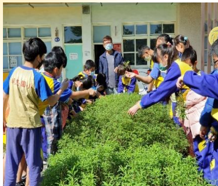
五年級食農課程：香草種植