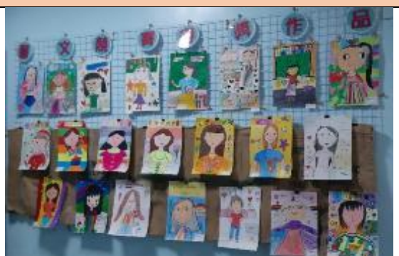
教師節藝文競賽作品