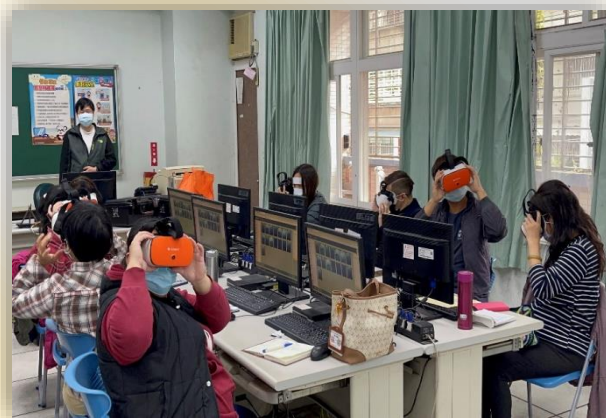
智慧學習教師進修