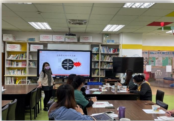
學習共同體教師研習