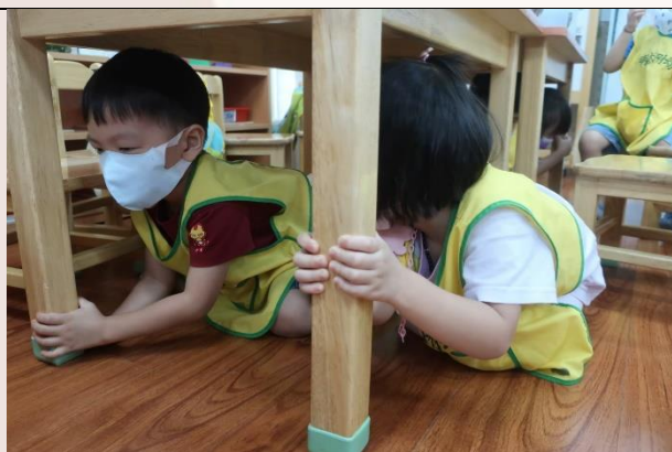
學校教會我們地震來時~要怎麼保護自己