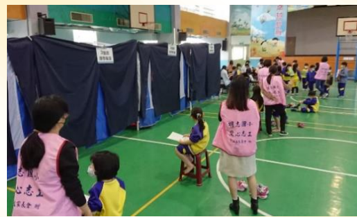
一、四年級健康檢查