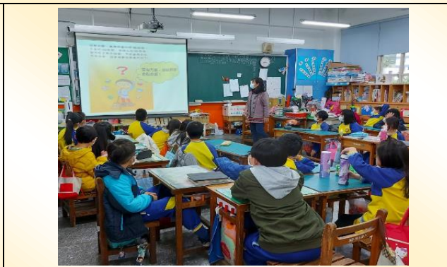
中年級線上營養宣導