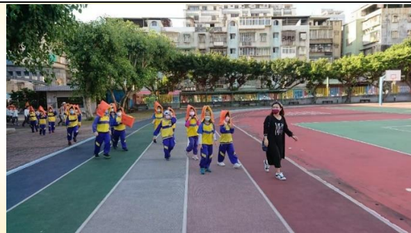
進行防災逃生演練