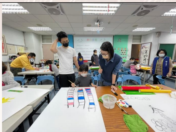
舉辦米羅創意畫，增進親子間的互動