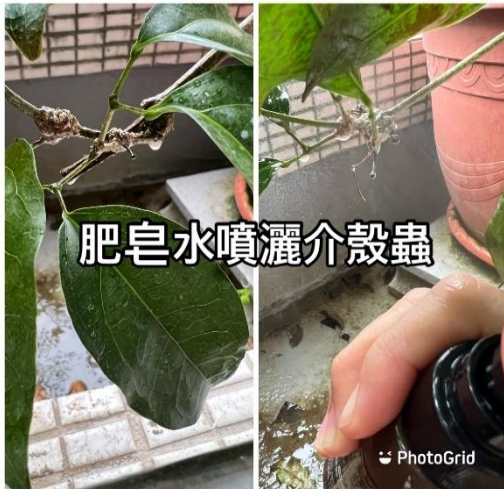
肥皂水噴灑介殼蟲