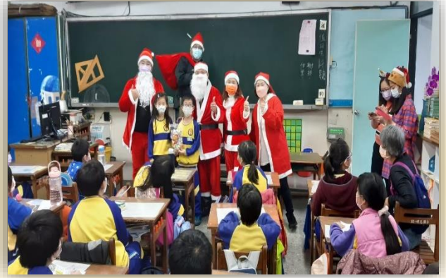
家長會辦理聖誕節活動