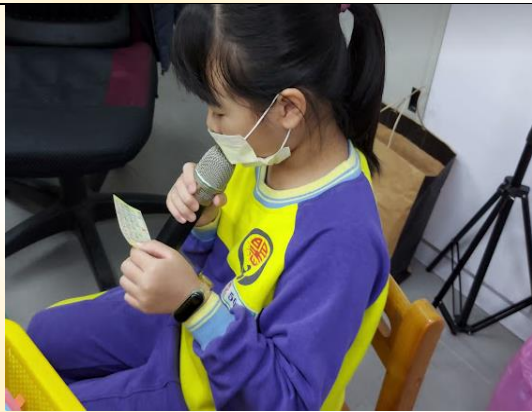
聖誕節活動-感恩卡播音