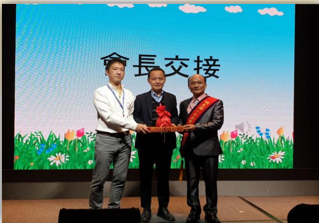
家長委員參與萬聖節活動協助