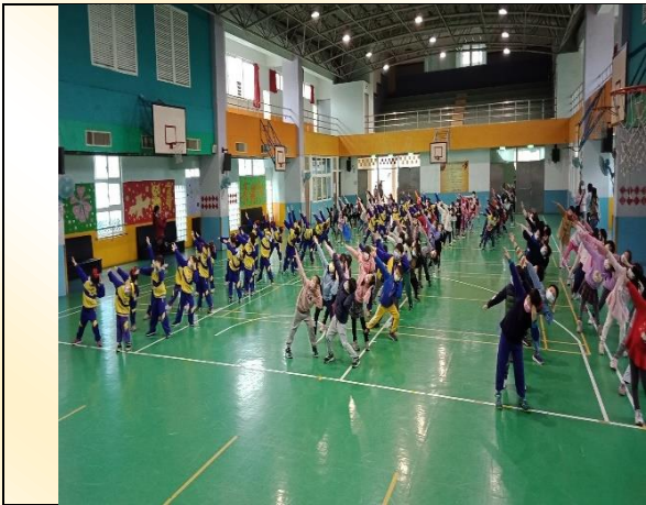
一年級健身操比賽：健康笑嘻嘻