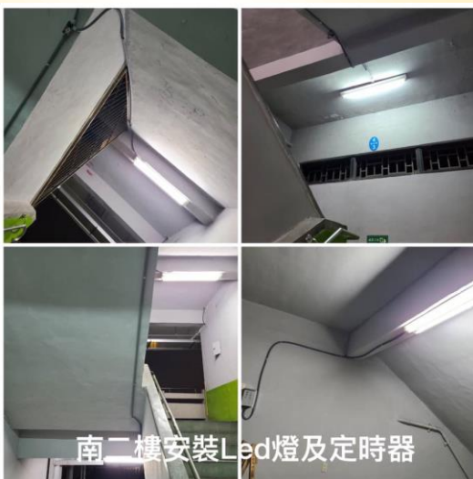
南二樓安裝Led燈及定時器

推動永續校園環境，改善校內土壤土質，增加生物多樣性 美麗明志，隨著校園內的環境改變，越來越多的訪客來和孩子們作伴了 我們也期待透過和孩子共同探索，讓孩子能親近自然，愛護我們的土地