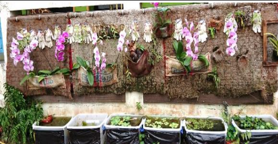
夢幻芳園新增：蕨類蘭花區