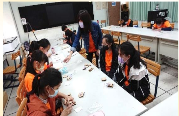
六年級食農課程：雷雕紋創禮盒