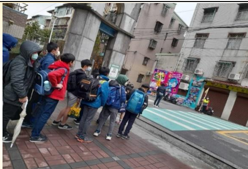
進行學生通學導護