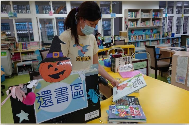
家長委員參與圖書館服務活動