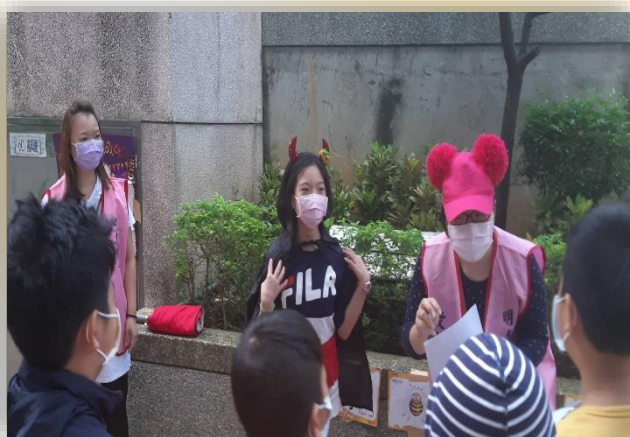
英文補救志工辦理萬聖節活動