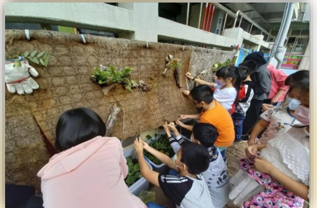
食農教育實驗課程