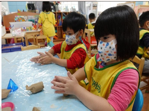
透過捏陶，增進寶貝們手部的精細動作，也發揮創意與童趣來創作