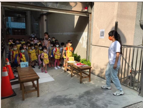
疫情期間，採分時分流放學，大家乖乖排隊