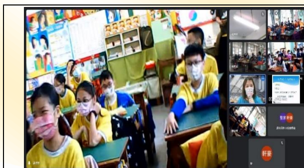
六年級反毒線上宣導