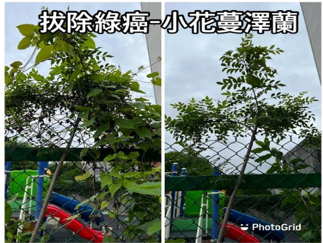
拔除綠癌-小花蔓澤蘭