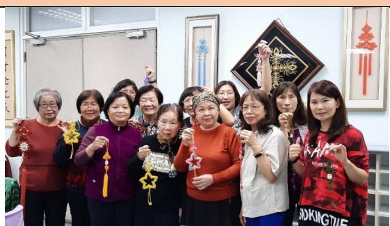
樂齡學習中心中國結藝班課程