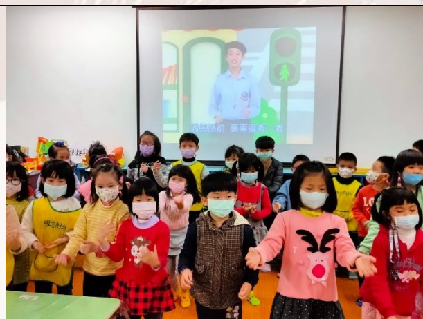
宣導不同主題，一起在玩樂中學習