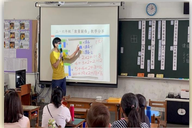
數學亮點教師研習