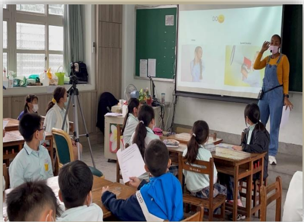
外師雙語實驗課程