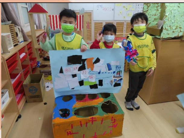
跟著主題課程，孩子們發揮創意，相互合作