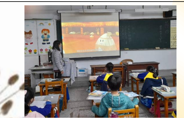
低年級線上營養宣導