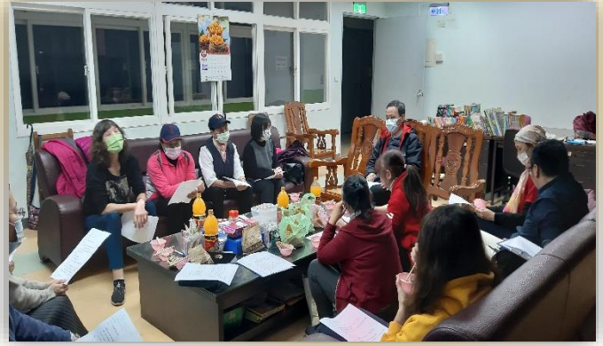
定期召開志工幹部會議交流意見