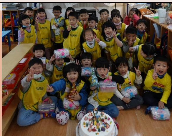
每到慶生會就很開心!有健康好吃生日蛋糕和生日禮物，還有收到滿滿的祝福唷