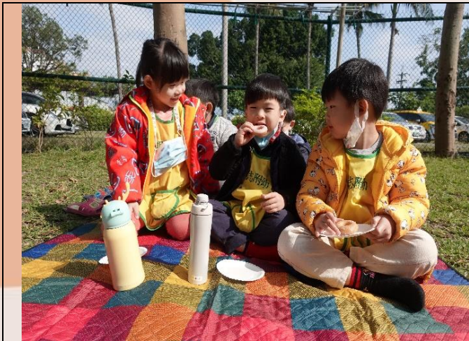
明志寶貝擁有一片開闊的前庭大草地，可以去散步也可以遊戲