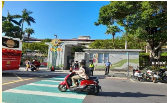
校長擔任導護志工， 守護學童上學過馬路的安全