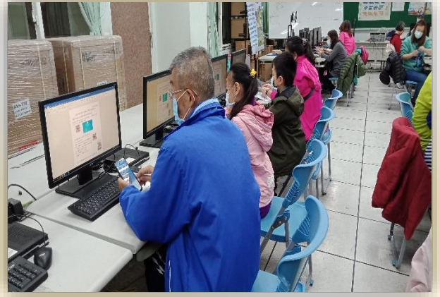
志工特殊訓-科技零距離活動