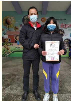
學生朝會頒發品德小天使獎狀