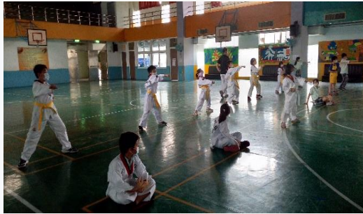
跆拳道社團拳腳功夫了得

(二)110學年度上學期受疫情影響，社團開設有限。體育性社團開設有桌球社及跆拳道；藝文性社團開設攝影社、藝術創作及讀經班(線上課程)，讓學生培養興趣、修身養性。