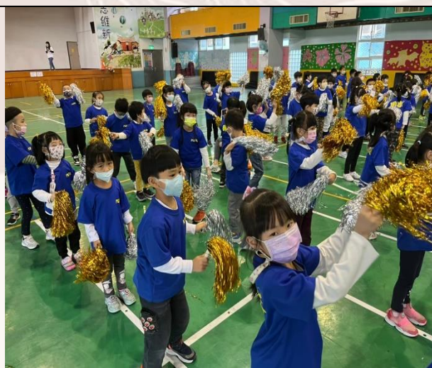
氣球傘及彩棒的舞蹈，舞出孩子的自信