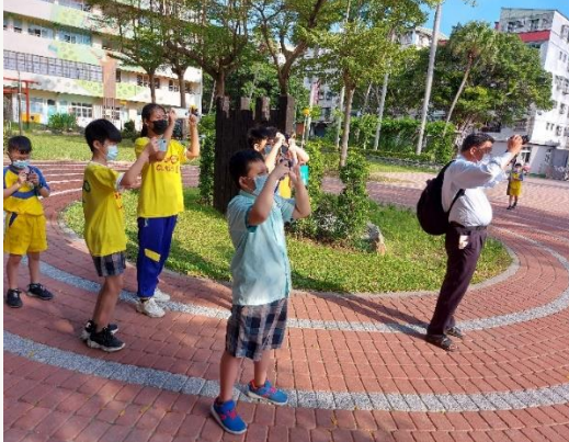
攝影社課程，學習攝影美學