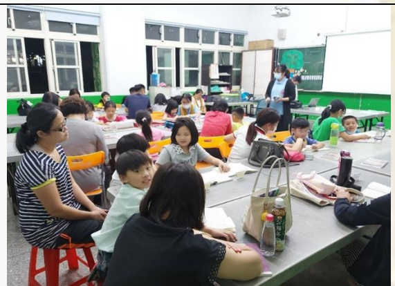
讀經班(轉為線上課程)