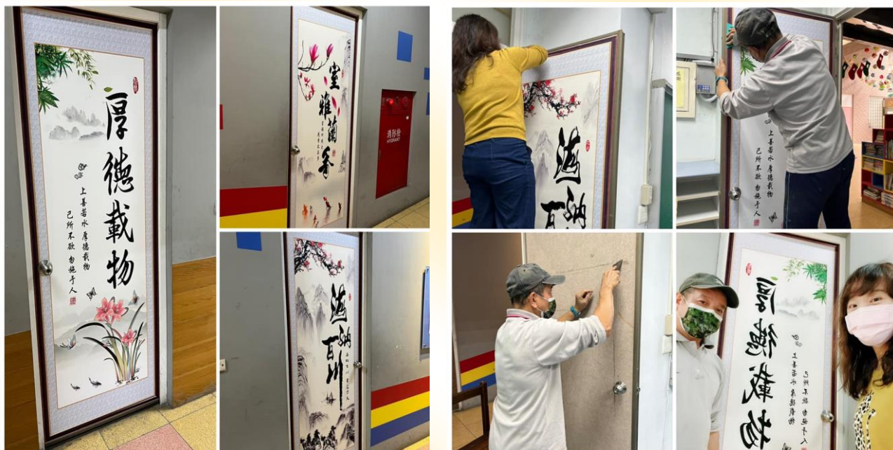
校舍美化-從環境改變，讓孩子潛移默化，具人文氣息