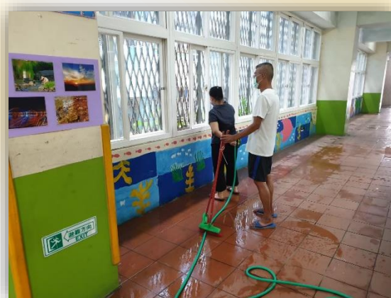
志工協助學校環境整理