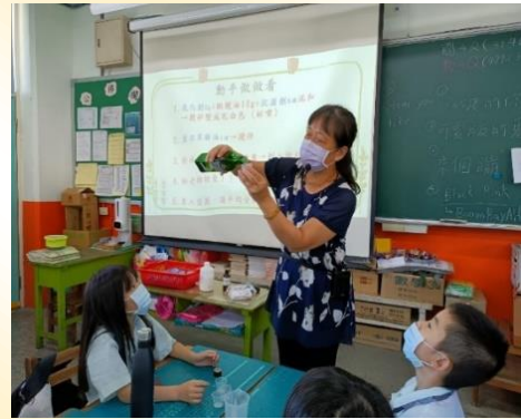
四年級食農課程：香草乳液