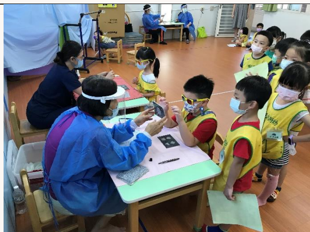
幼兒健康檢查，請專業醫師及護理師協助