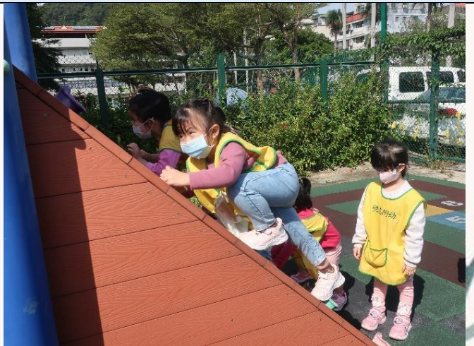
當然溜滑梯遊戲場還是我們的最愛