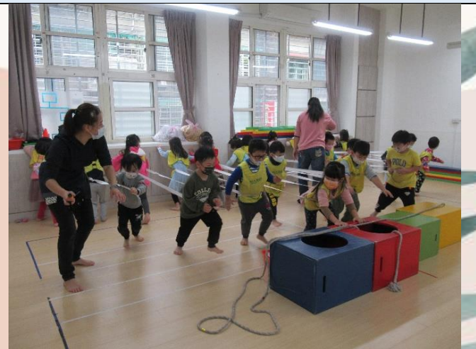
下雨了我們還有活動室可以進行體能遊戲呢