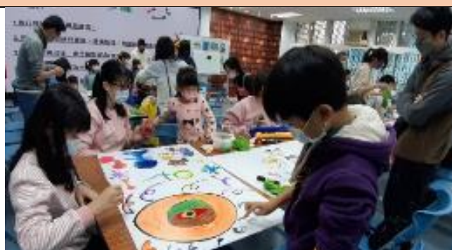
米羅創意彩繪活動