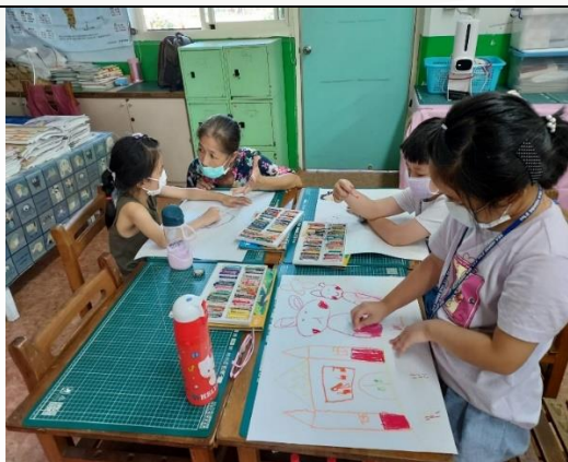
藝術創作社，能欣賞美學