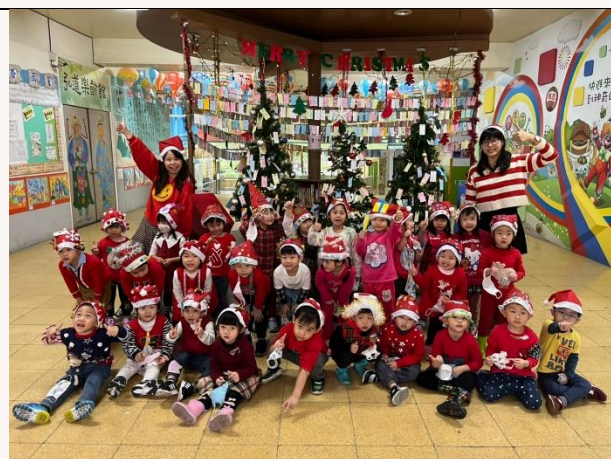
家長會委員扮成聖誕老公公，和幼兒一起同樂