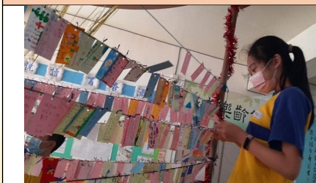
聖誕感恩祝福活動