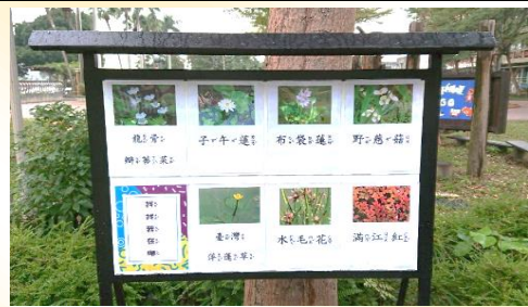
夢幻芳園新增：水池教學欄