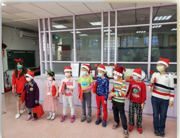
英語歌唱學生社團