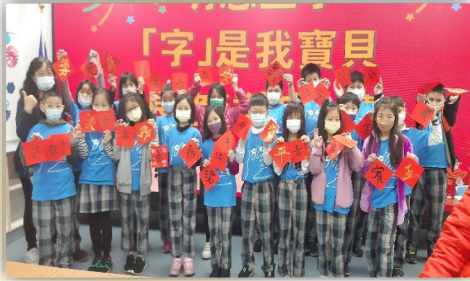
志工協助長者送"字"慧活動