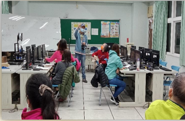
志工特殊訓-科技零距離活動