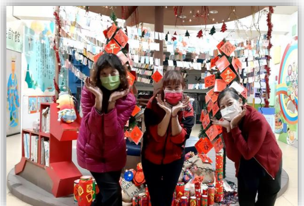
志工配合年節活動布置校園