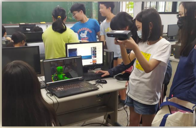
程式設計實驗課程