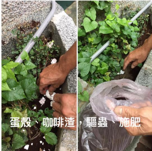
蛋殼、咖啡渣，驅蟲、施肥