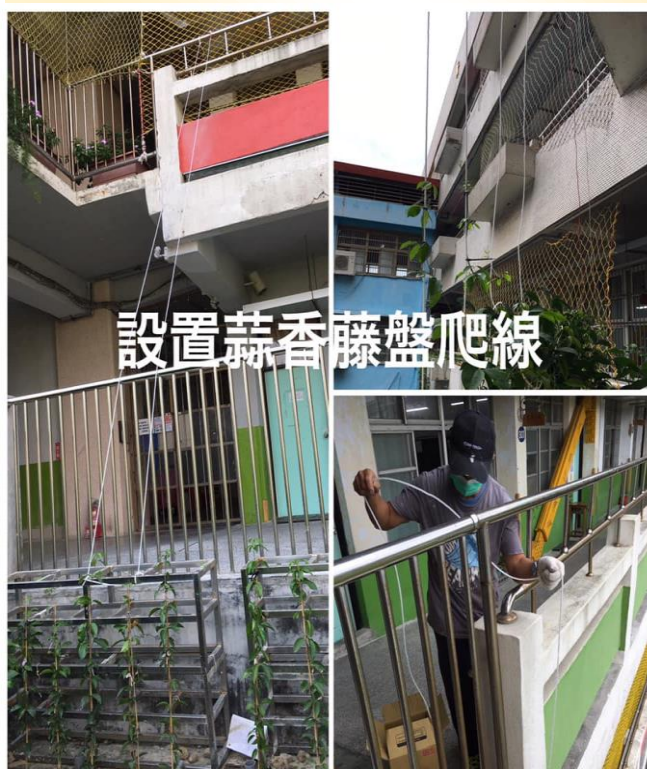
設置蒜香藤盤爬線