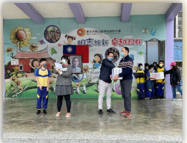
閱讀推動-讀報有獎徵答