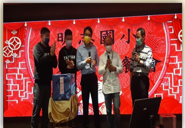
歲末感恩餐會活動