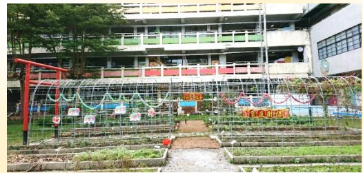
夢幻芳園新增：攀藤植物架