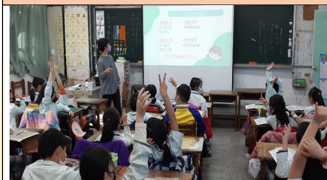
正念教育宣導活動