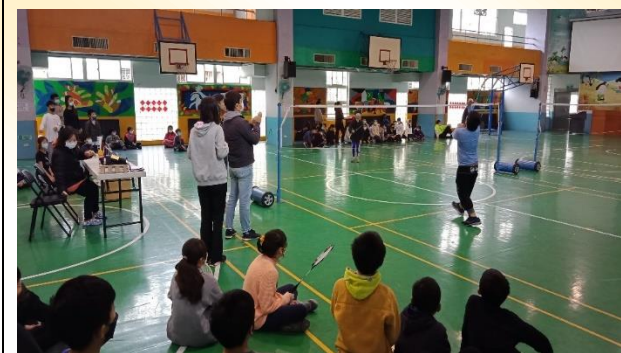
五年級羽毛球比賽