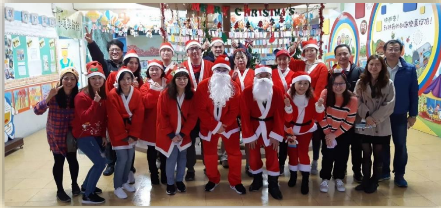
家長會辦理聖誕節活動