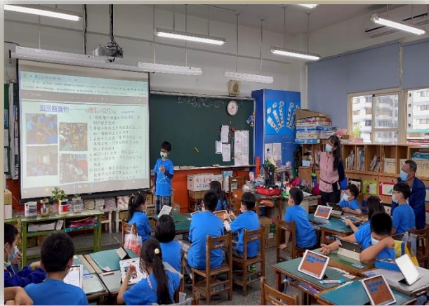
平板學習成果發表