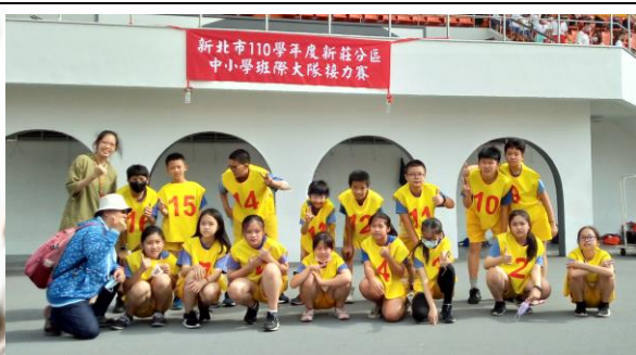
參加新莊分區中小學班際大隊接力賽