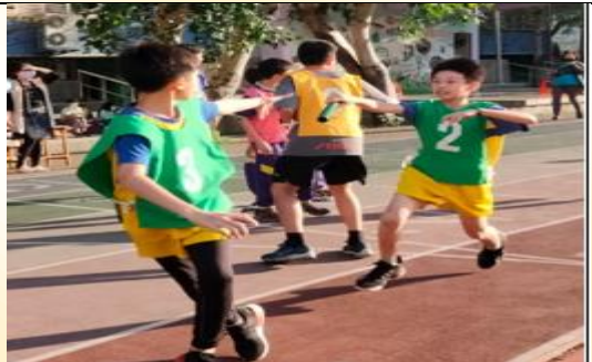
競爭刺激的大隊接力賽