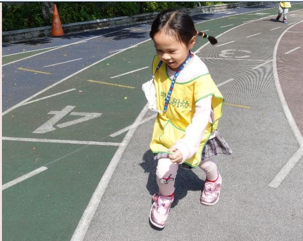
我們也和哥哥姊姊們一樣在操場跑跑跳跳