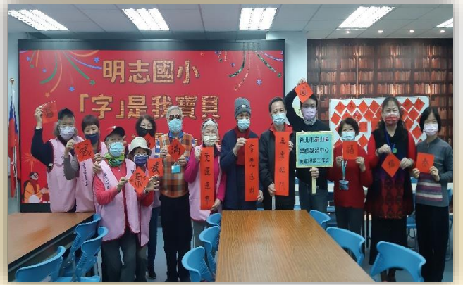
志工協助長者送"字"慧活動