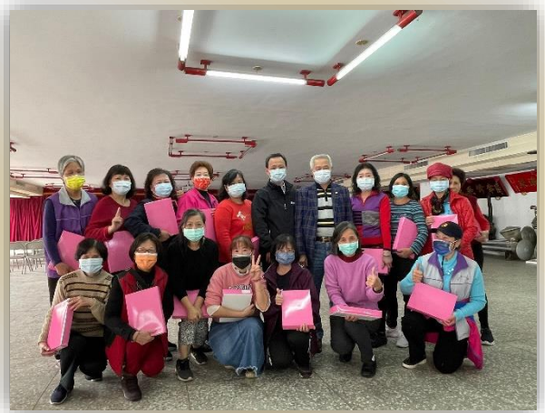
志工歲末感恩餐會