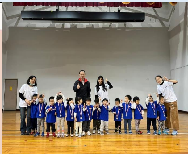
認真參與的孩子，一起共享這份榮耀