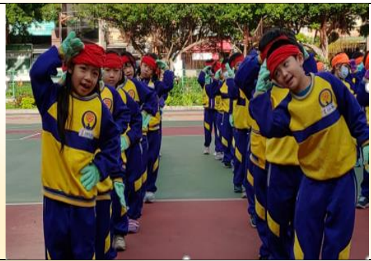
第 46 屆校慶運動會表演節目