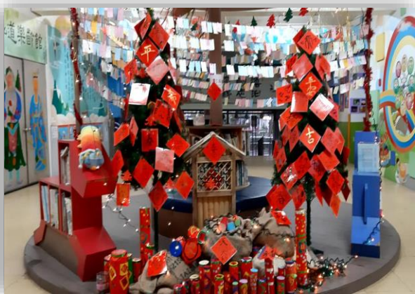
志工配合年節活動布置校園