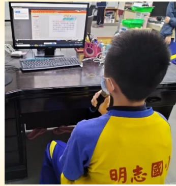
環保小局長在兒童朝會宣導