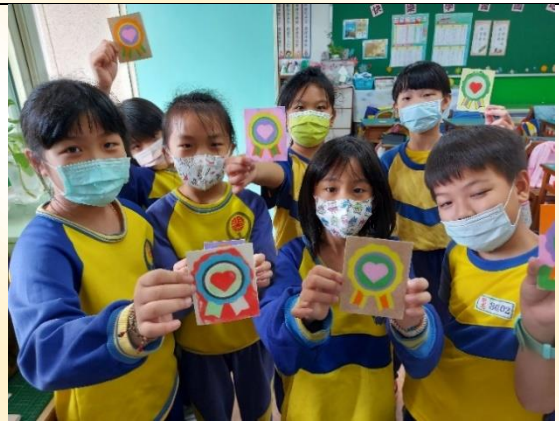
創世基金會義賣及砂畫活動