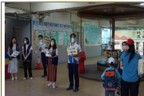
一年級新生迎新活動