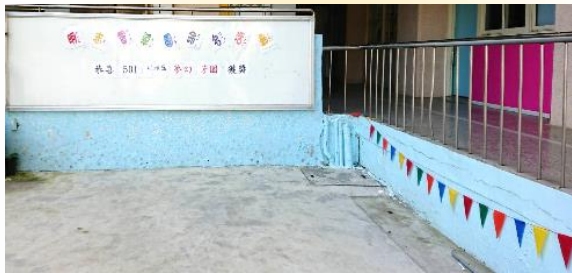
食農教育之命名篇：夢幻芳園