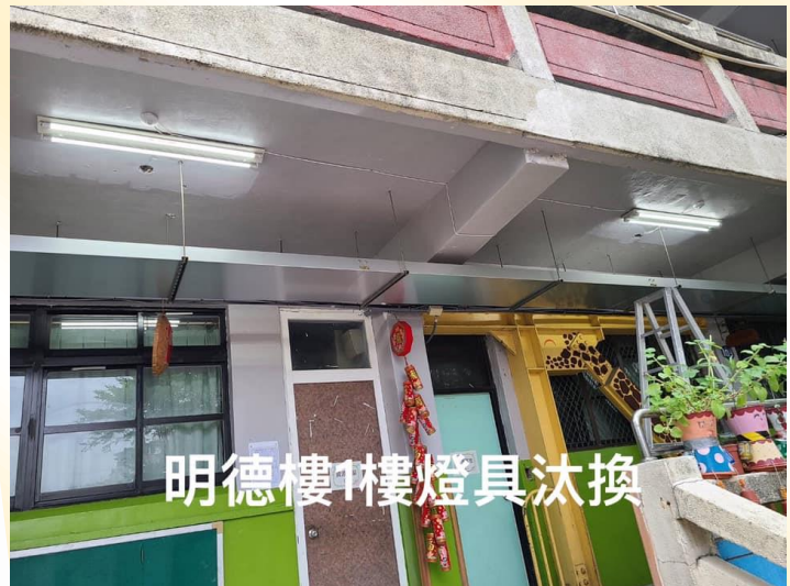
明德樓1樓燈具汰換