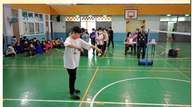
六年級羽毛球比賽