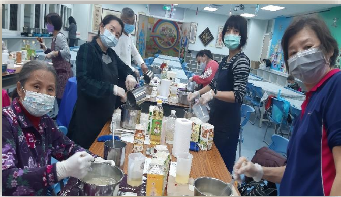
志工特殊訓-健康生活護”皂”活動