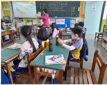
三年級食農課程：食物里程介紹