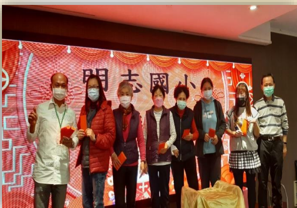
歲末感恩餐會活動