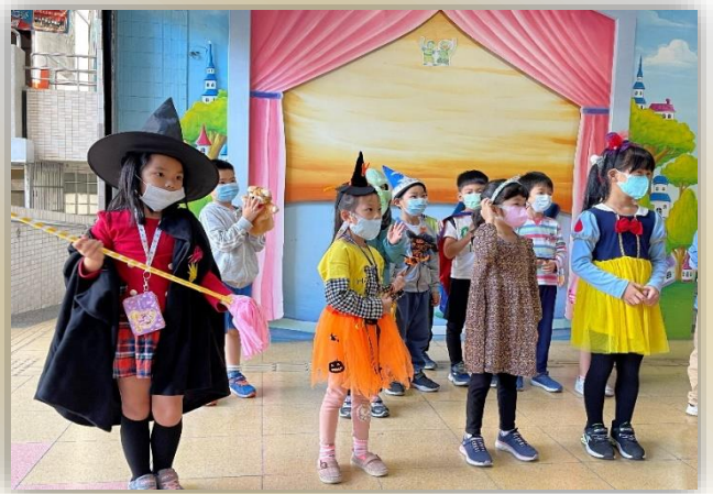
萬聖節英語闖關活動