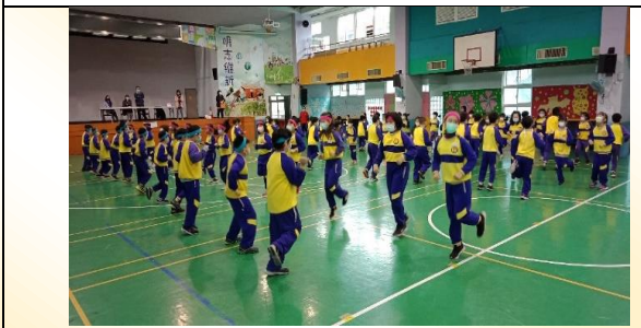
三年級健身操比賽：全身運動功效好