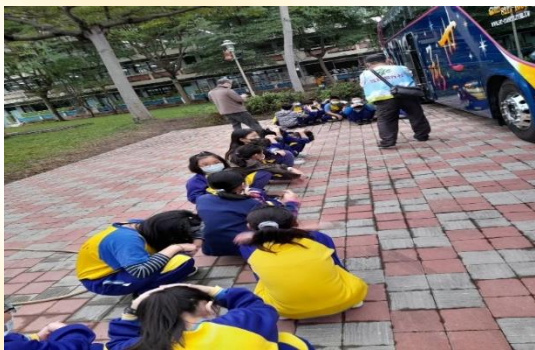
宣導學生辨識大型車 內輪差與視野死角教育