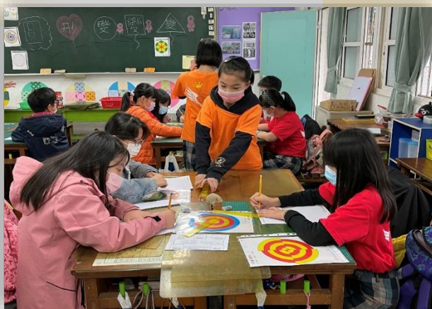
班級數學闖關活動