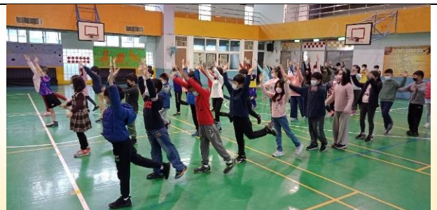
四年級健身操比賽：身體健康精神好