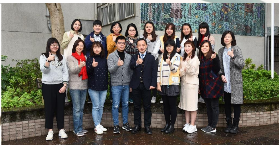
最專業的明志附幼團隊