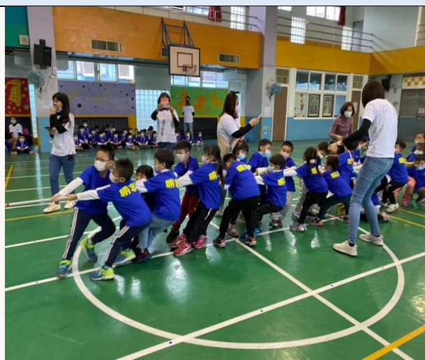
多樣的趣味競賽，從中體驗運動的樂趣