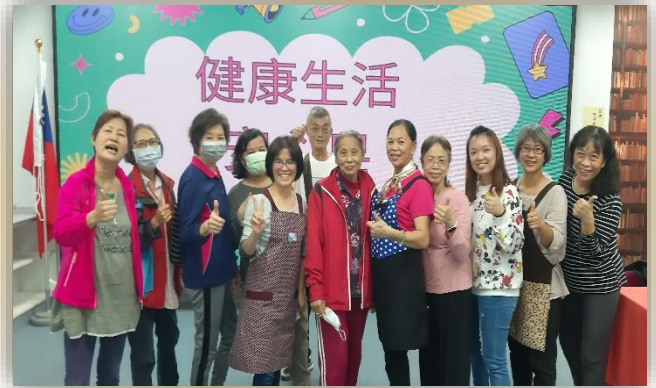
志工特殊訓-健康生活護”皂”活動