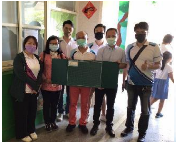
111 學年度補助新生桌墊隔板