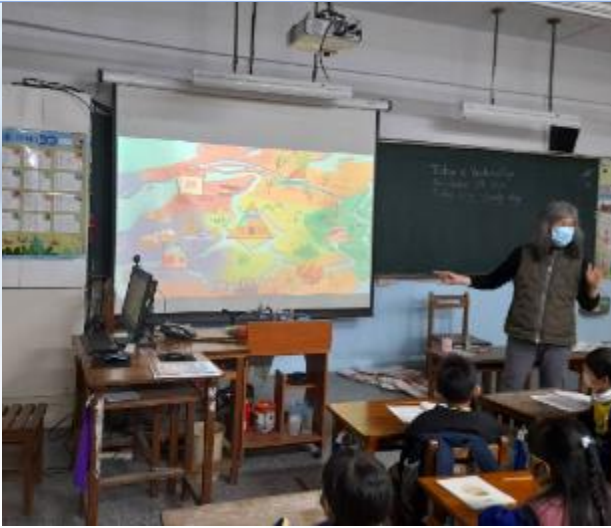
健康促進活動：在教室進行潔牙、使用牙線宣導、營養講座宣導。