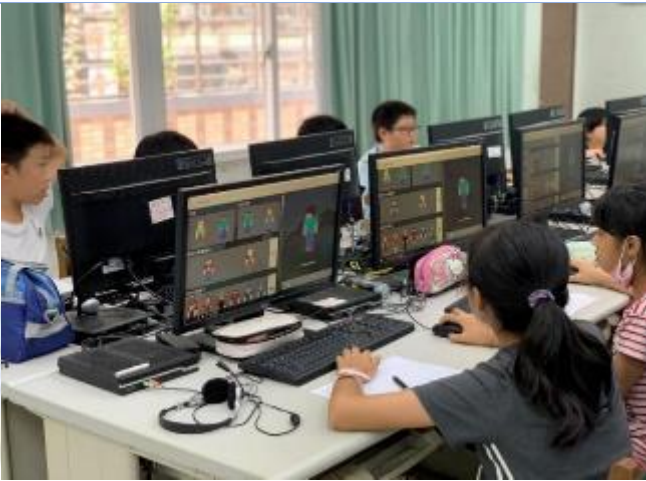
程式設計實驗課程