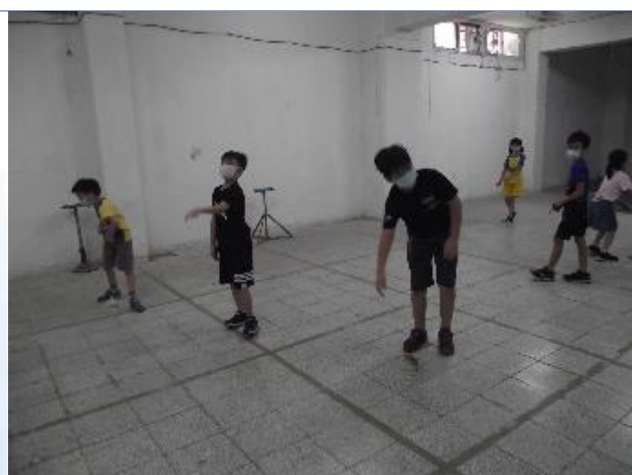
民俗體育社團：踢毽子