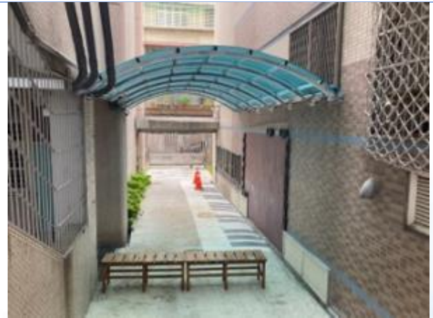
有雨遮好棒！不怕風吹日曬雨淋！