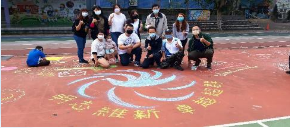
110 學年度兒童節彩繪大地活動