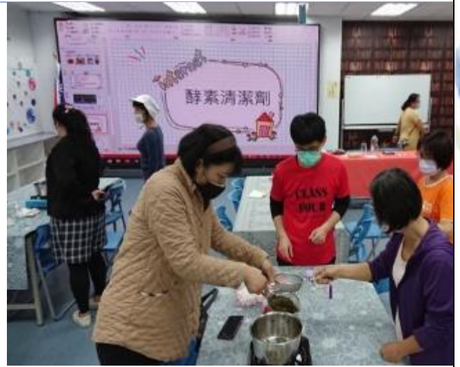
食農教師增能：酵素清潔劑