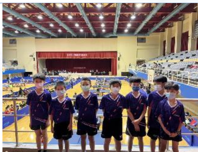
新北市桌球重點發展學校 桌球隊男生組參加小學運動會