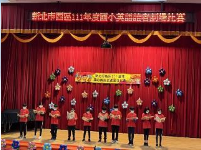
新北市西區國小英語讀者劇場比賽