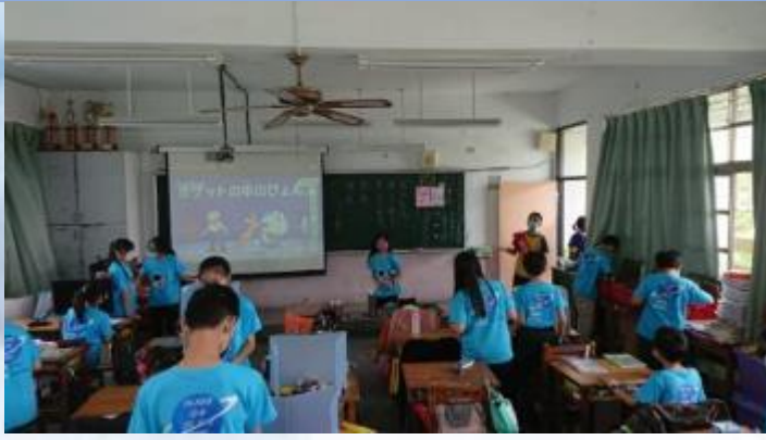
環保小局長到各班宣導節能減碳