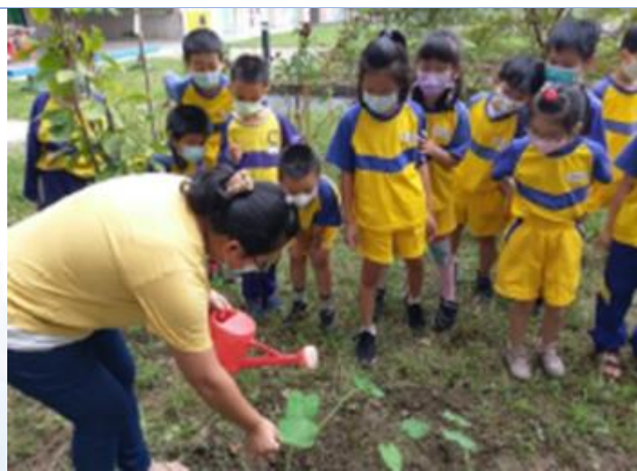
食農教育：種植與介紹過程。