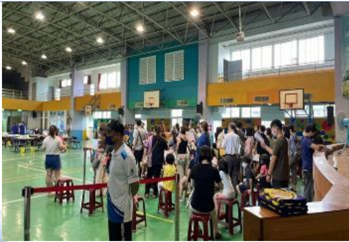
新冠肺炎疫苗接種