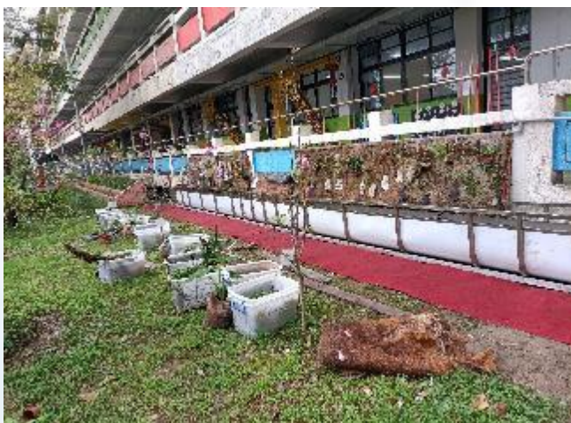
中庭蕨類牆的建置