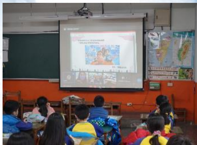
專輔教師辦理遠距輔導講座