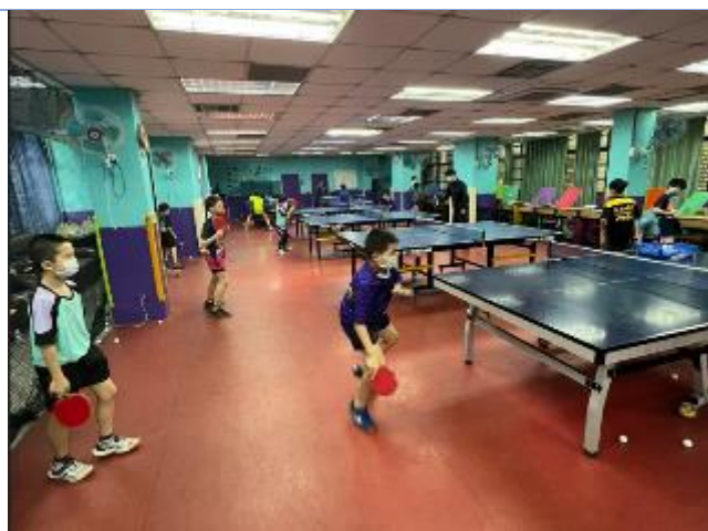
桌球社團：培育少年國手