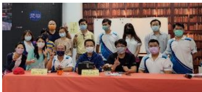
110 學年度召開家長委員會