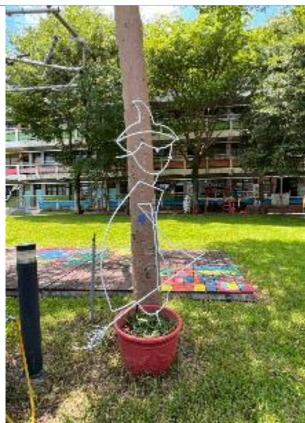
校園環境綠美化成果