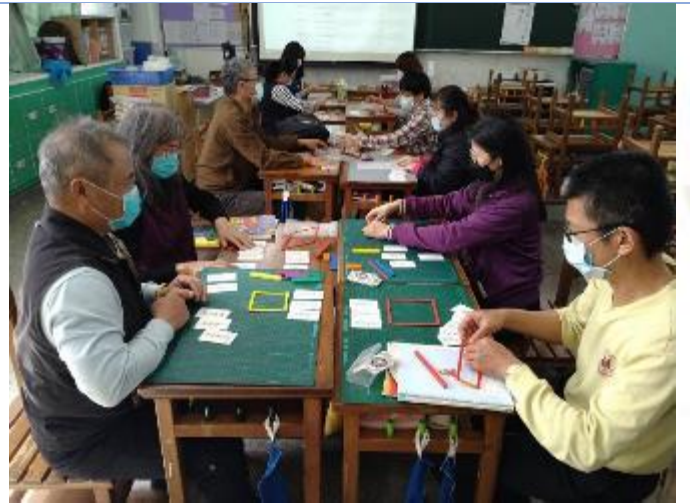
教師數學亮點研習