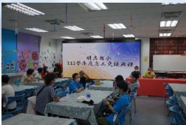
志工幹部交接典禮