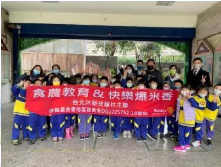
台北沐新扶輪社-快樂爆米香食農活動