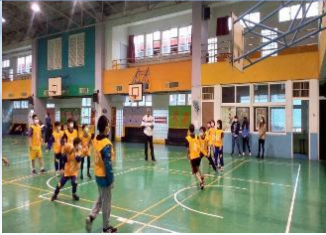
籃球隊甄選-歡迎加入籃球隊