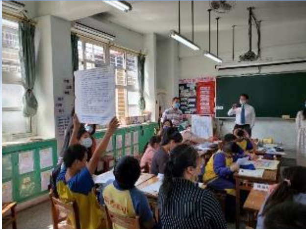
學習共同體公開課