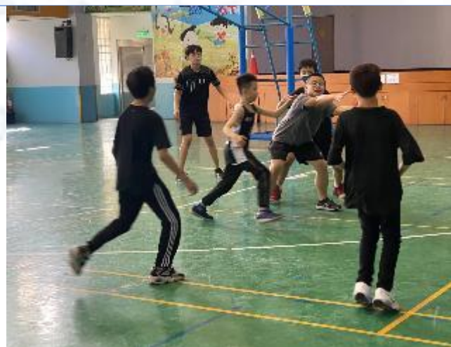
籃球社團：攻守皆佳