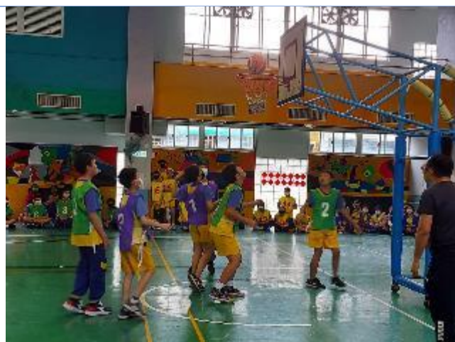
六年級三對三籃球賽