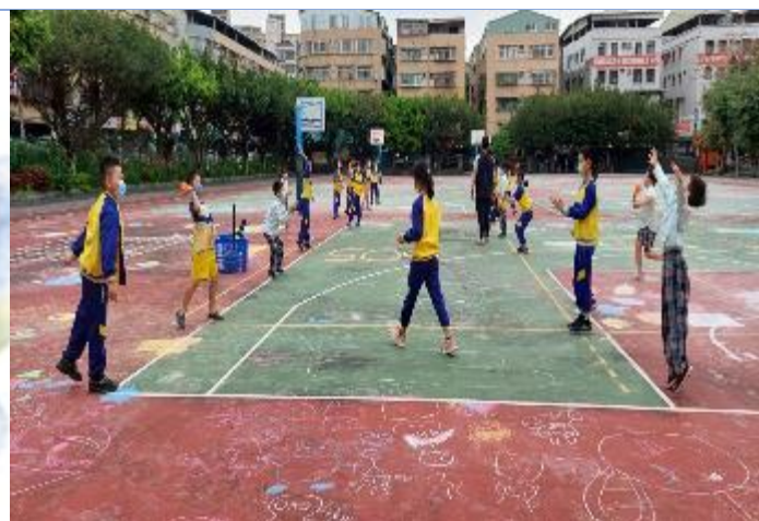
樂樂棒球社團：接球練習