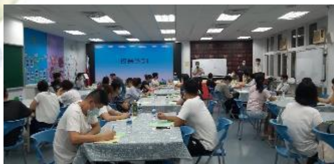
110 學年度家長代表大會