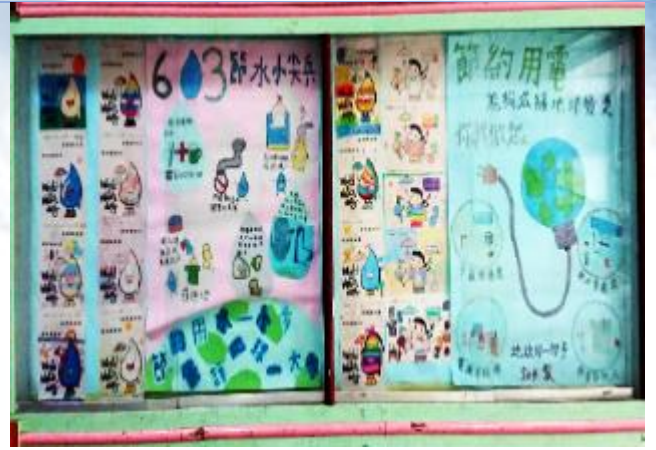
環保小局長活動：塗鴉、小書、海報設計比賽。