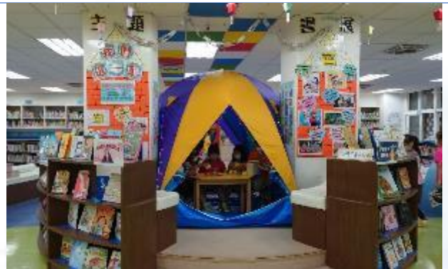
閱讀推動-主題書展 我們這一家