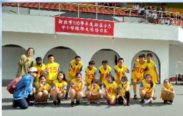
新莊分區班際大隊接力賽