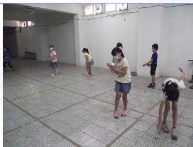
民俗體育社團：踢毽子