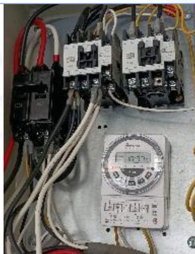
一般維護修繕：自來水管更新、飲水機電源系統改善