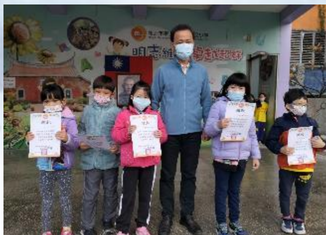
每月品德小天使頒獎