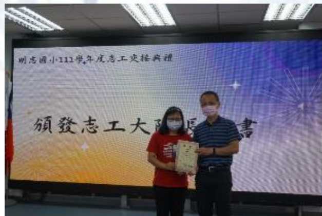
志工幹部交接典禮