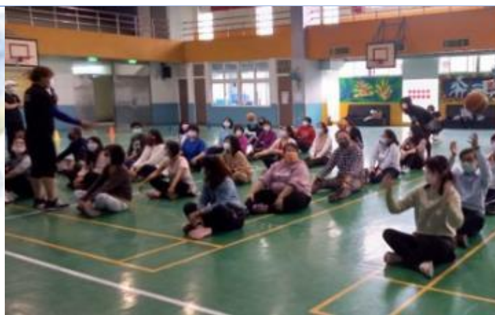
教師體適能增能活動