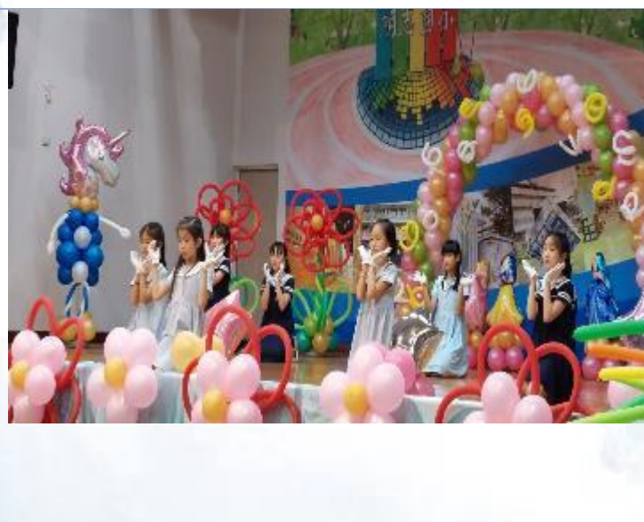
舞林盟主舞蹈比賽