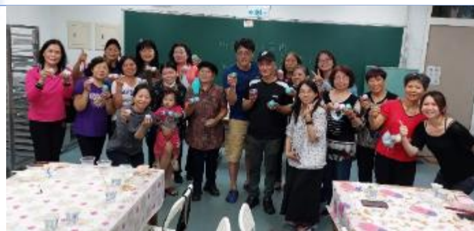
111/3/17 家長會、志工們一起製作乳液