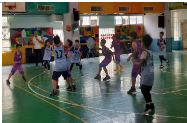
籃球隊校際交流賽