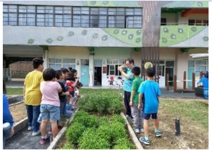
食農教育實驗課程