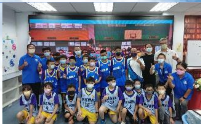
籃球隊贈送球衣活動