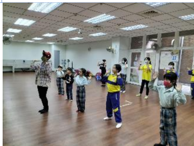
流行舞蹈社團：曼妙舞姿