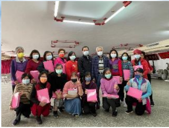
志工隊歲末聯歡活動