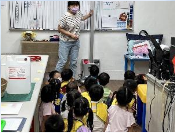
期初身高體重測量