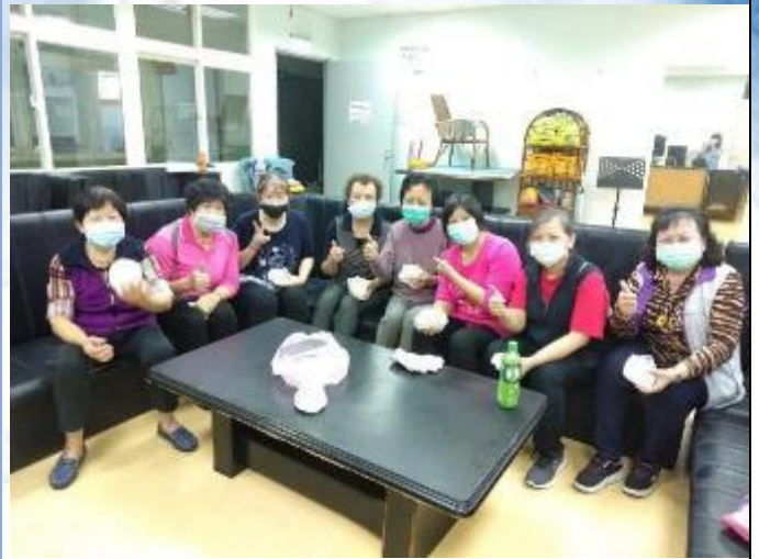
志工聯誼室搬遷整理