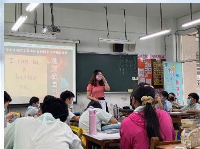
專輔教師入班進行班級輔導課程