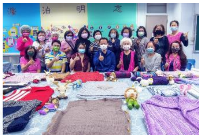
樂齡學習中心課程