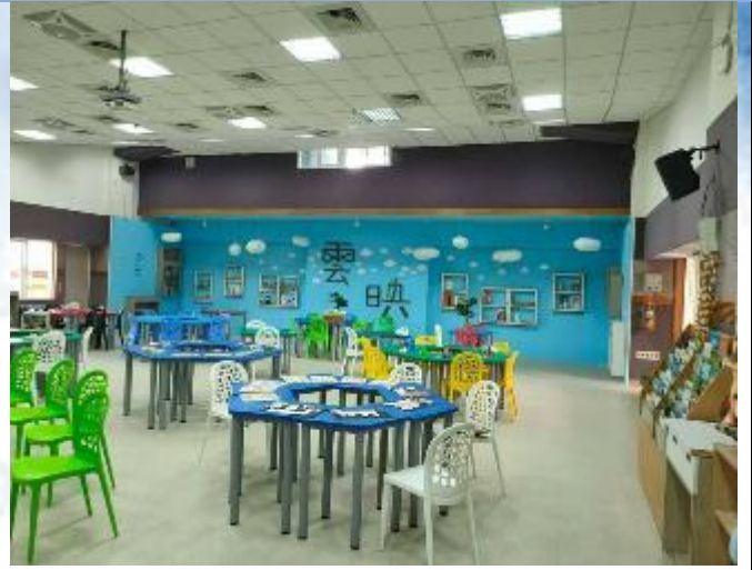
改善工程成果：班班有冷氣、雲映教室建置。