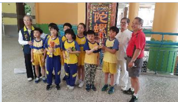
參加民俗體育競賽榮獲佳績