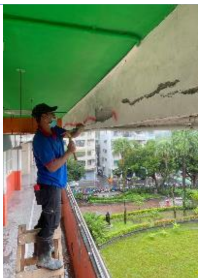
一般維護修繕：體健樓三、四樓鋼筋裸露處理。