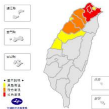
中央氣象局針對台灣地區發布高溫紅色、橙色及黃色燈號範例