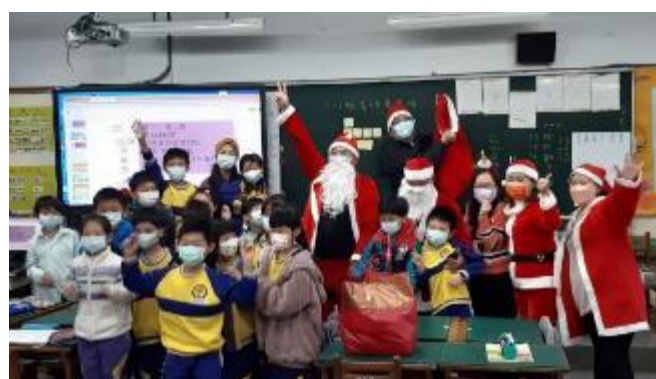
聖誕節節慶活動-一年一度的聖誕佳節， 由家長會夥伴、校長及行政同仁一同讓孩子感受佳節帶來的喜悅