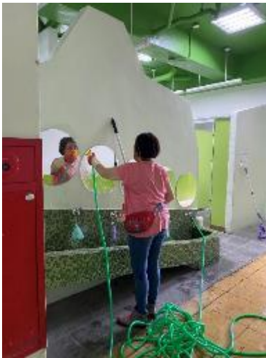
編列經費請專人在學期初清潔廁所。