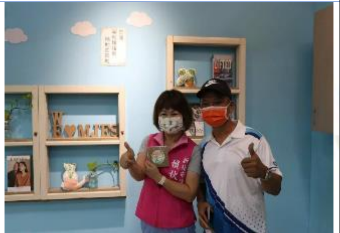
改善工程成果：雲映教室建置。