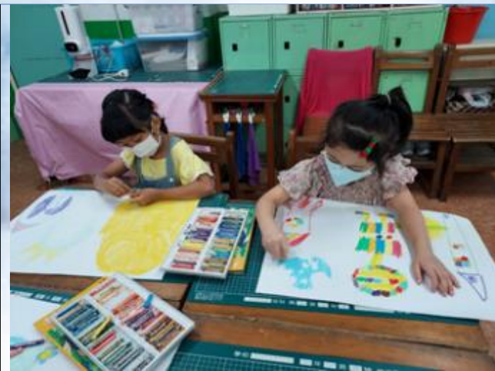
藝術創作社，能欣賞美學