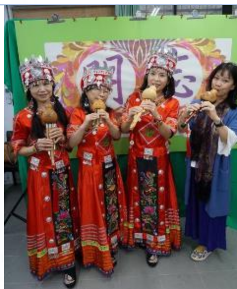
葫蘆絲演奏社成立宣導活動