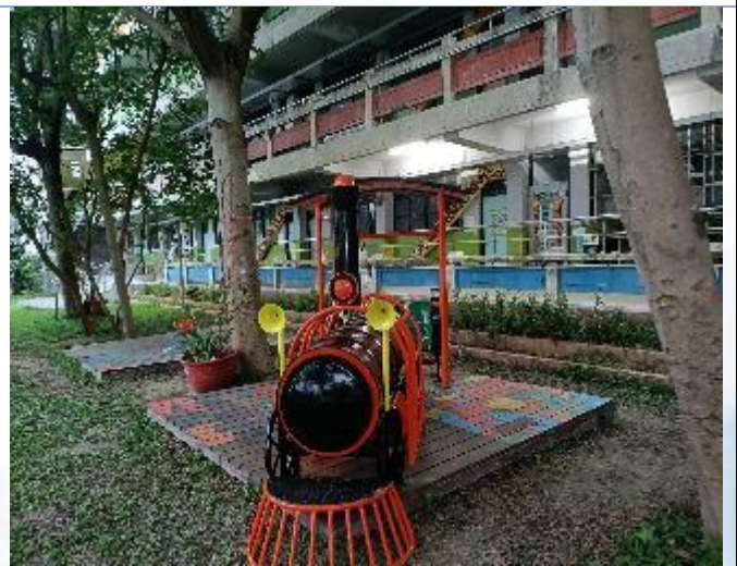
校園環境綠美化成果