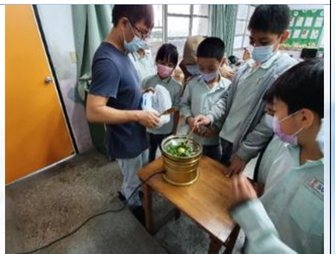
食農教育：茶葉烘焙課程。