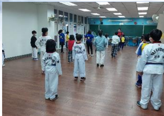
跆拳道社團：功夫了得

體育性社團開設有桌球社、籃球、MV 舞蹈、足球及跆拳道，讓學生在課餘時間能多運動，鍛鍊身體並且培養良好運動習慣。藝文性社團開設攝影社、藝術創作及讀經班，讓學生培養興趣、修身養性。