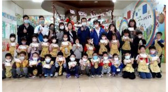
110 學年度發送兒童節禮物