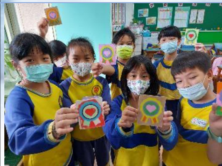
創世基金會義賣及砂畫活動