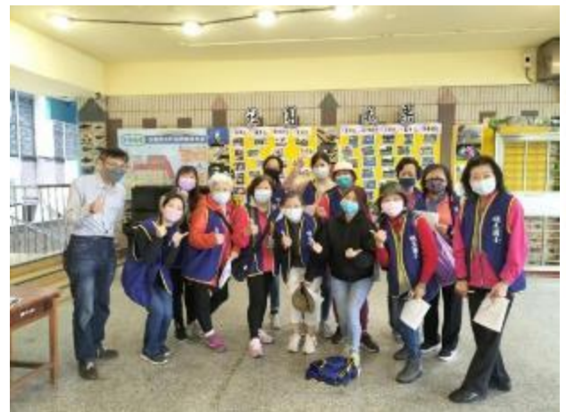
111/3/29 志工協助兒童節活動