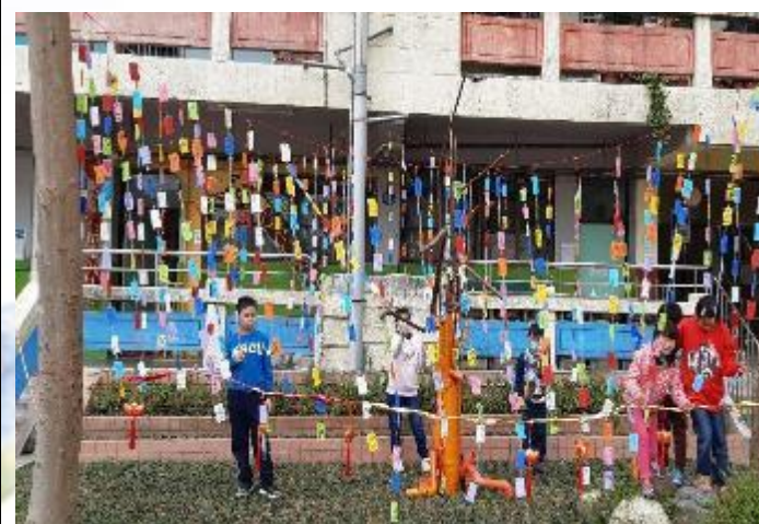
生命教育祈福許願活動