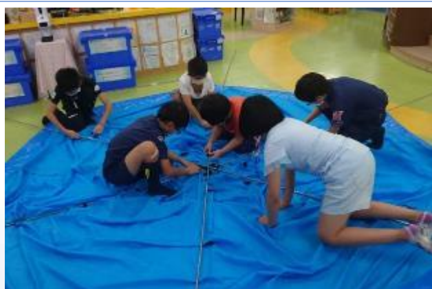
童軍活動，練習搭帳篷