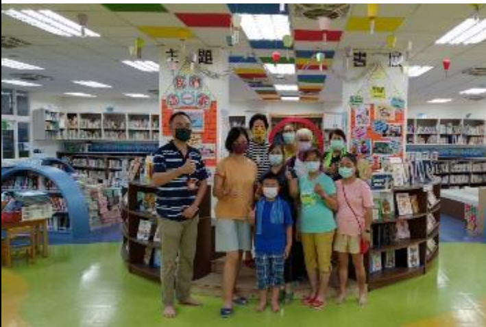
書香志工協助開學前圖書館大掃除