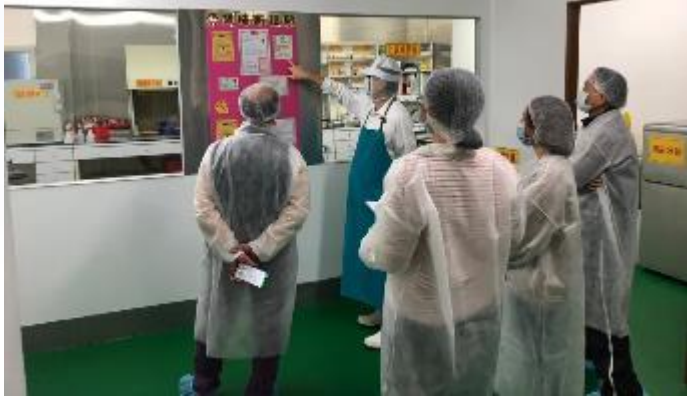
家長委員至餐廚公司訪廠，確保餐點品質