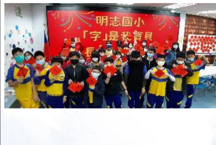
樂齡中心「字」是我寶貝活動