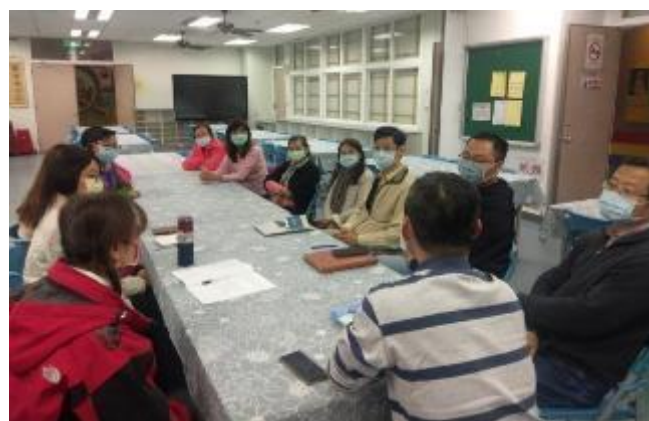
定期召開志工幹部會議