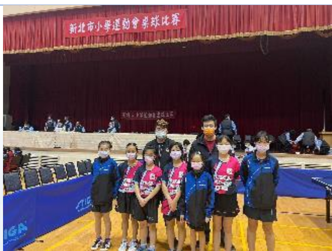
新北市桌球重點發展學校 桌球隊女生組參加小學運動會