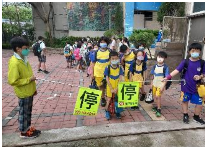
每日放學導護生輪值安排及指導