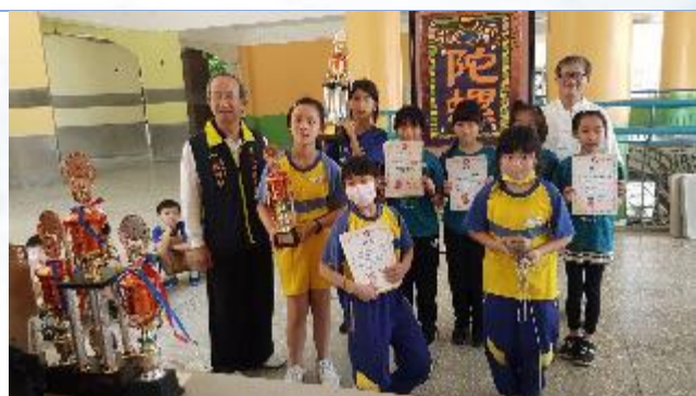
創藝盃陀螺團體賽第二名