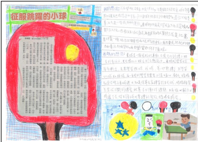
106 上學期 親子讀報比賽作品