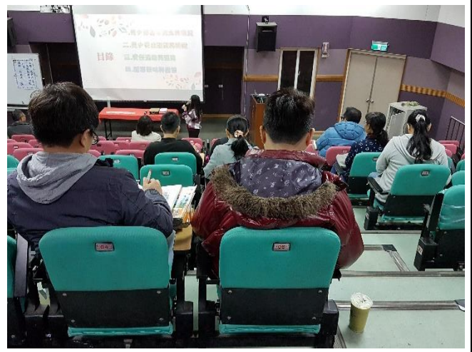
106/12/13 性平、兒少保、高風險知能研習