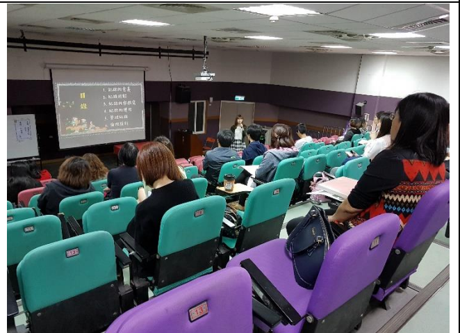
107/04/18 輔導技巧與紀錄撰寫知能研習