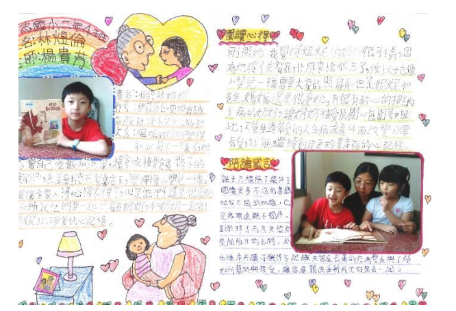
106 下學期 親子共讀比賽作品