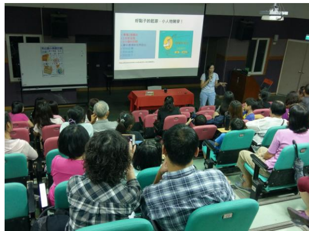
106/10/13 講座~親子閱讀一起來：讀人，讀書，讀世界