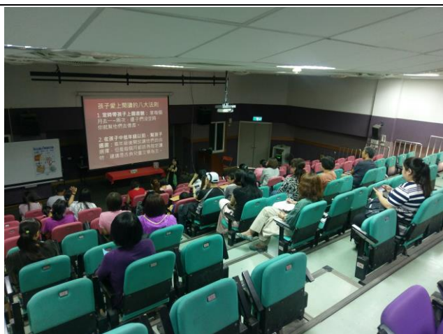
106/11/10 講座~讓孩子愛上閱讀的八大法則