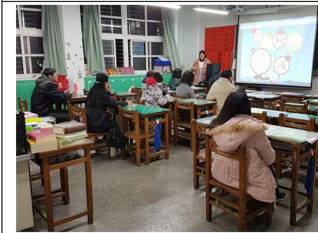
107/03/09 下學期家長日活動