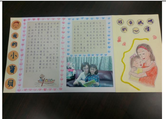
106 上學期 親子繪本創作比賽作品