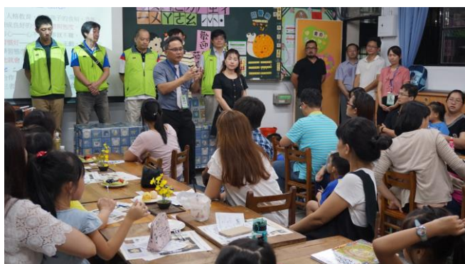
106/09/08 上學期家長日活動