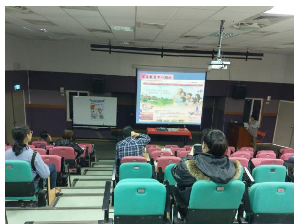
106/12/15 講座~愛家-幸福家庭 123 宣導