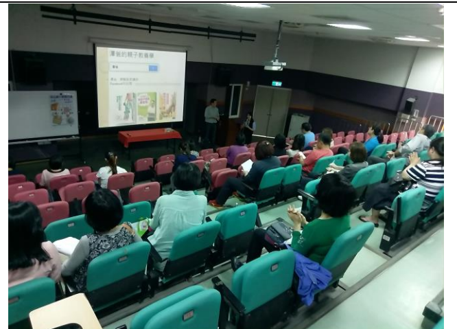
107/04/20 講座~不打不罵也能教養孩子