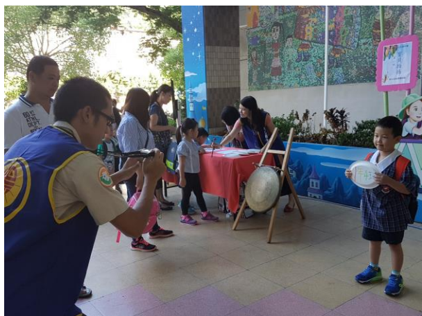
106/08/30 新生迎新闖關活動