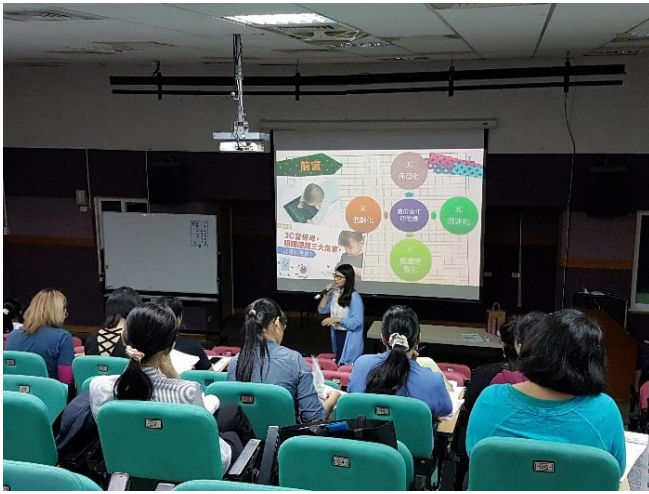
106/11/08 網路成癮辨識與輔導研習