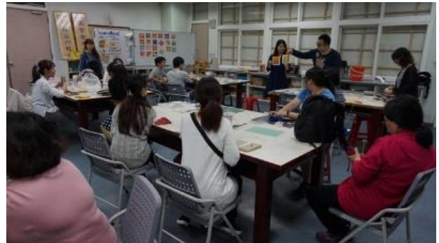
107/11/21 和諧粉彩輔導研習