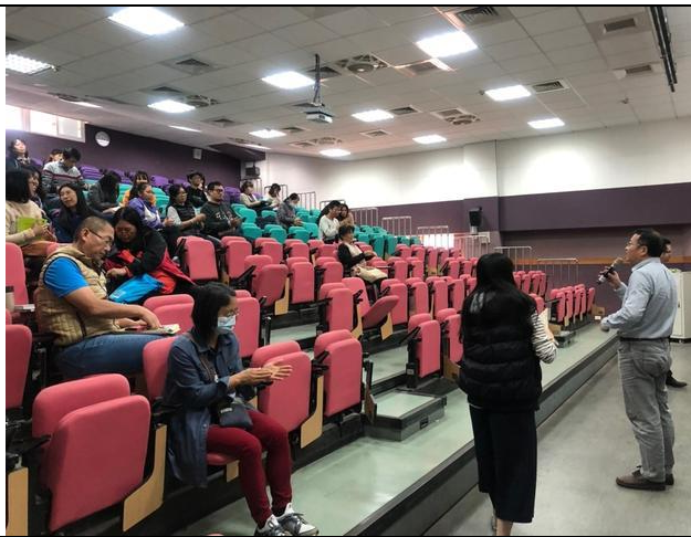
107/12/19 性別平等教育研習