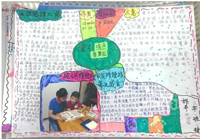
107 親子共讀比賽作品