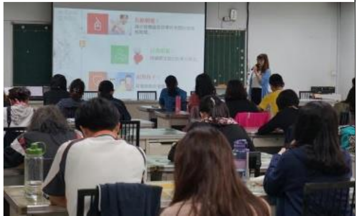
108/05/01 學校危機事件處遇與輔導策略