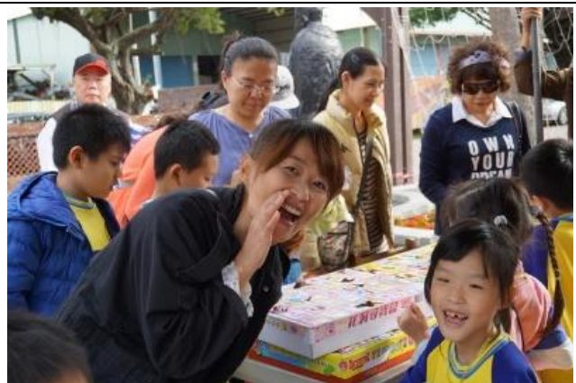
107/12/08 校慶暨親子園遊會