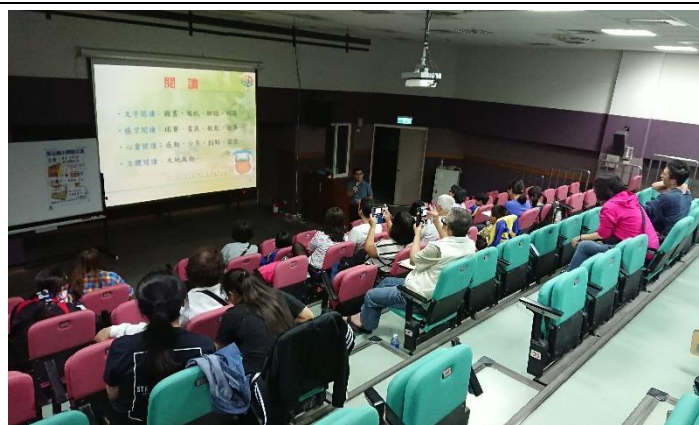
107/10/18 講座~愛家-幸福家庭 123 宣導