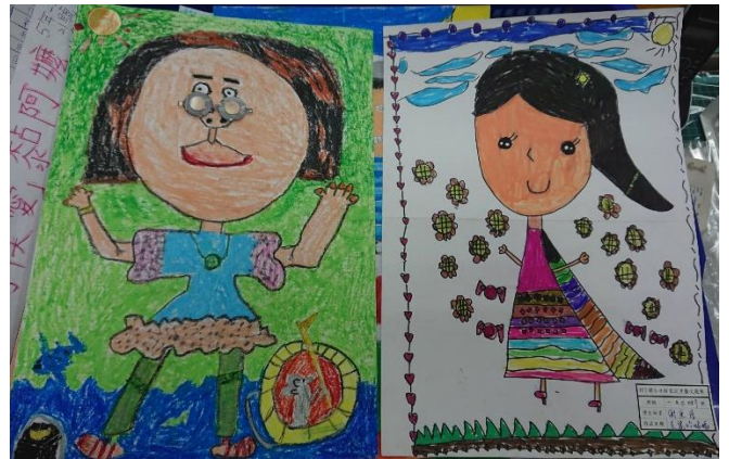
107 孝親家庭月藝文低年級競賽作品