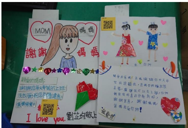
107 孝親家庭月藝文中年級競賽作品