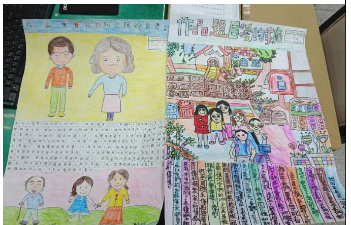
107 孝親家庭月藝文高年級競賽作品