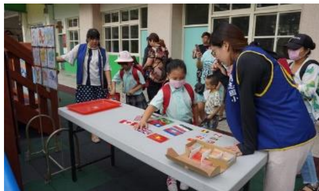
107/08/30 新生迎新闖關活動