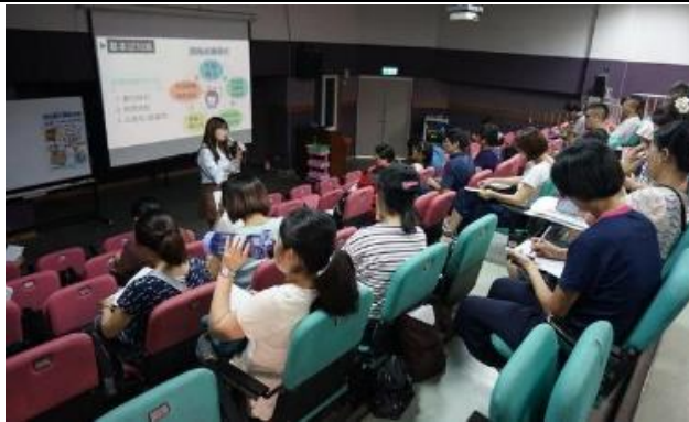
107/09/05 網路成癮辨識與輔導研習