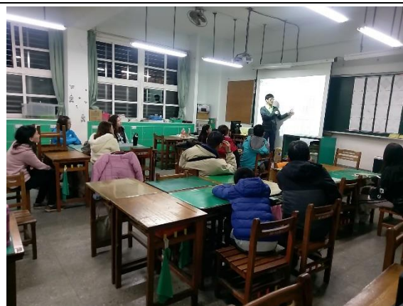
107/09/07 上學期家長日活動